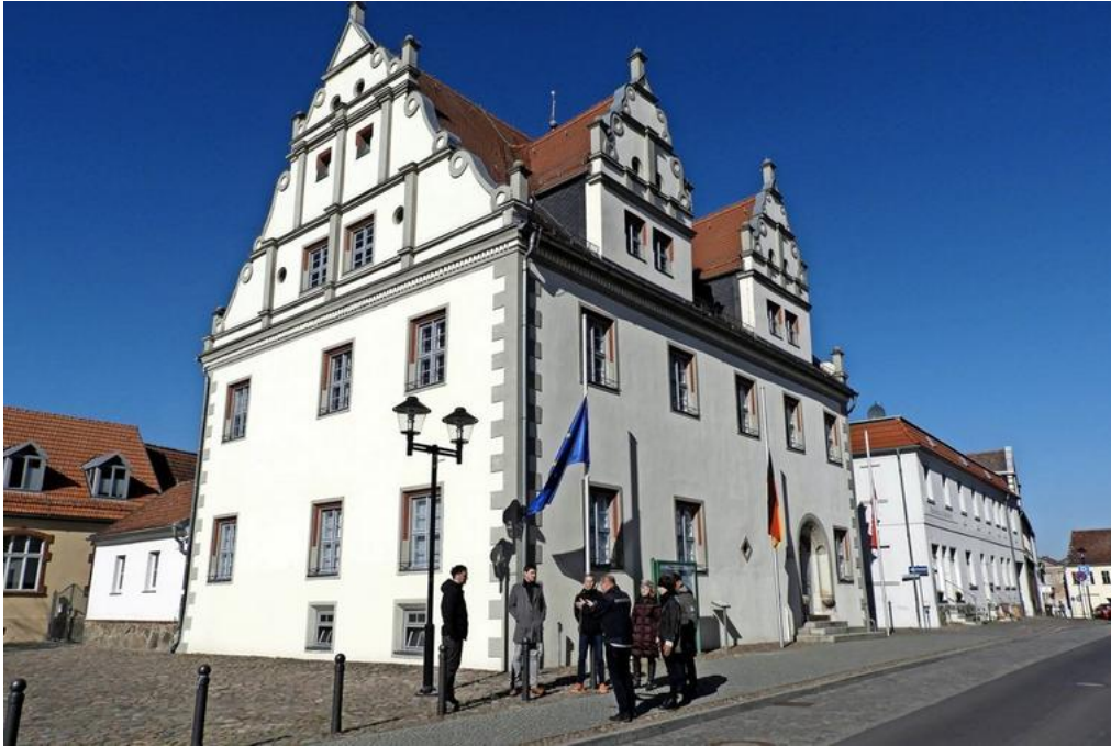
Die geplante Infotafel über Robert Koch soll neben dem Rathausgiebel aufgestellt werden. Von dort blickt man direkt auf das Wohnhaus in der Großstraße 69.

Zur kleinen Tafel am Wohnhaus des Mediziners soll jetzt eine weitere kommen. Angedacht ist eine Infotafel, die sich in Größe und Form an die vor dem Rathaus und der Kirche bereits aufgestellten Tafeln orientiert. Sie waren aus Anlass des Deutschen Wandertages im Hohen Fläming 2012 erarbeitet und installiert worden. Touristen und Gäste der Stadt nutzen diese Tafeln gern als Wissensvermittler und Tourenratgeber.